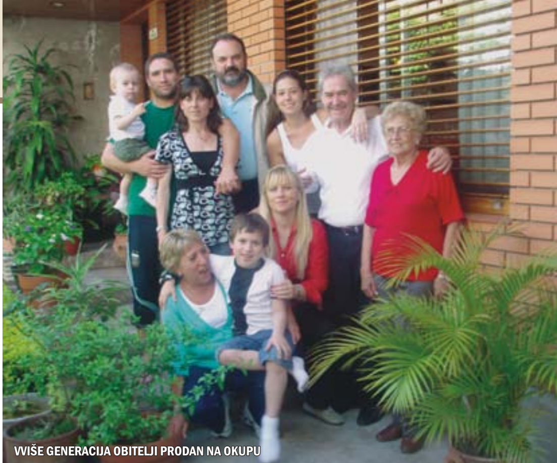
VIŠE GENERACIJA OBITELJI PRODAN NA OKUPU

- Prema onome što smo imali prigode vidjeti, život u Argentini je vrlo težak, protkan klasnim razlikama. I dok imate ljude koji jako dobro žive, ima i mnogo sirotinje po ulici. Krađe su, kako nam kažu rođaci, vrlo česta pojava. Naši rođaci uglavnom su dobrostojeći, jer svi su si uspjeli izgraditi kuće, dok automobil imaju samo neki, jer je to kod njih veliki