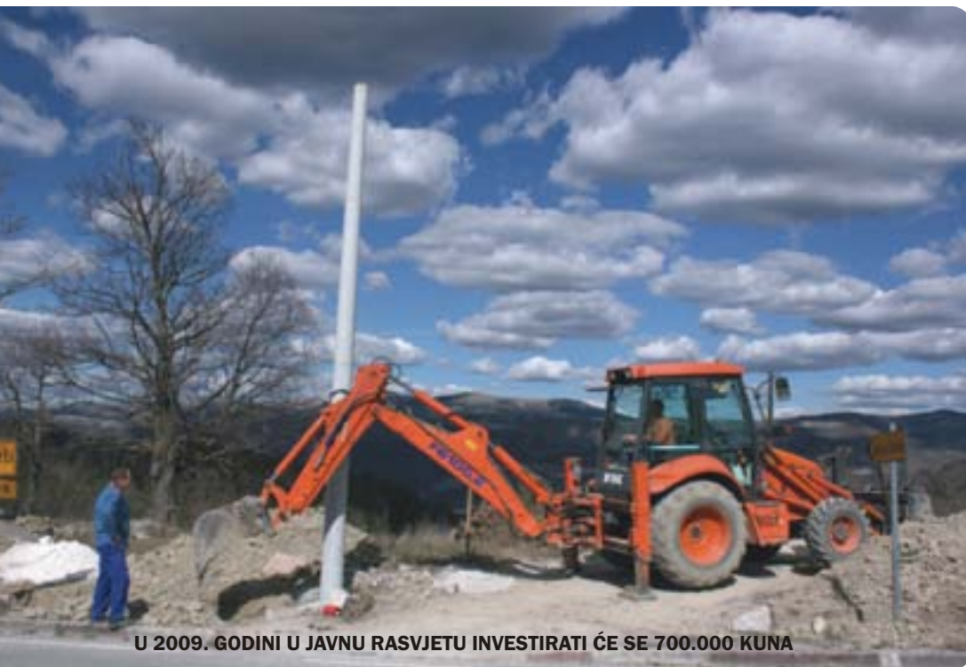
U 2009. GODINI U JAVNU RASVJETU INVESTIRATI ĆE SE 700.000 KUNA

Zatim, u planu je uređenje parkirališta iza zgrade Doma zdravlja u Buzetu, a uz to predviđa se sanacija oštećenja na kolniku u Ulici Augustina Vivode. Iako je taj kolnik već dotrajavao i jako je oštećen, u ovom trenutku je moguća samo sanacija dijela ulice koji se spaja na glavnu cestu prema Trgu Fontana. Potpuna rekonstrukcija i uređenje moraju pričekati rasplet situacije s bivšim