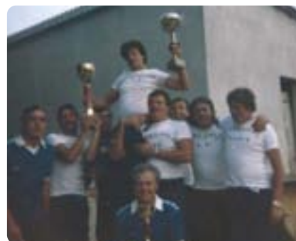
Najuspješnija 2007. godina

ligi i tako stječe pravo natjecanja u međuopćinskoj ligi, gdje 1986. godine osvaja naslov. Te se godine otvara još jedno bočalište koje su izgradili i financirali sami članovi kluba. Godine 1983. proširuje se sala za ples podno škole u Ročkom Polju, gdje mještani tradicionalno u drugoj polovici kolovoza slave blagdan Sv. Roka - Rokovu. Fešta povodom Rokove dugo je godina bila jedini izvor prihoda bočara iz Ročko Polja.