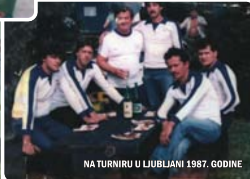
NA TURNIRU U LJUBLJANI 1987. GODINE