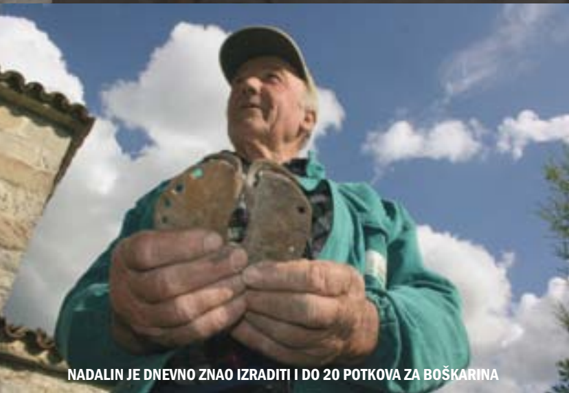
NADALIN JE DNEVNO ZNAO IZRADITI I DO 20 POTKOVA ZA BOŠKARINA