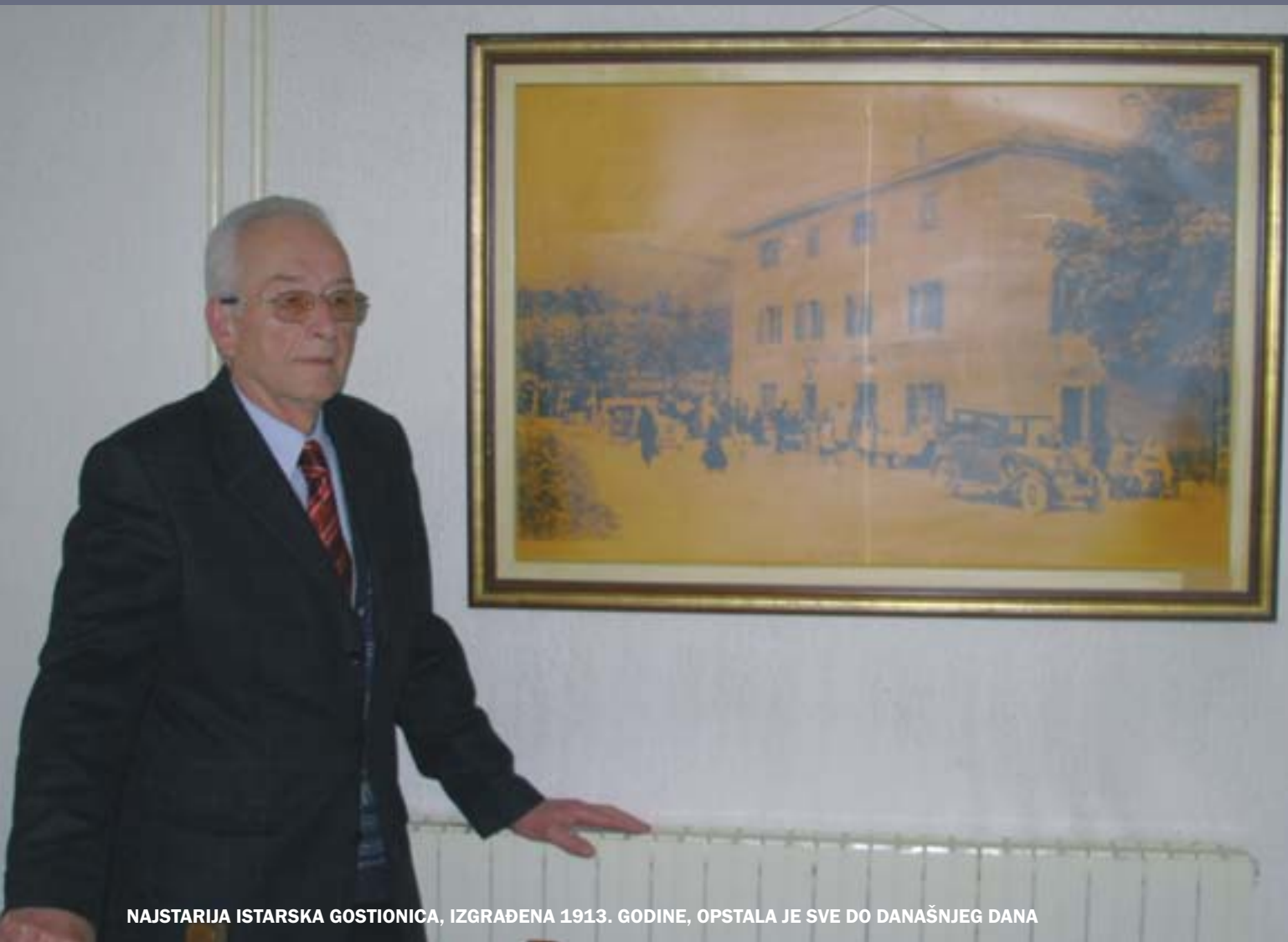
NAJSTARIJA ISTARSKA GOSTIONICA, IZGRAĐENA 1913. GODINE, OPSTALA JE SVE DO DANAŠNJEG DANA

Prvi smo na području bivše Jugoslavije imali obrtnike koji mogu zaposliti više od četrdeset radnika. Naša je općina u to vrijeme imala beneficije, pa su dolazili obrtnici iz drugih krajeva bivše države. Tadašnja općina Buzet imala je mnogo sluha za obrtnike i na različite načine pronalazila kanale kako da im pomogne.