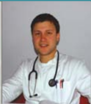
Piše: dr. Elvis ČERNEKA