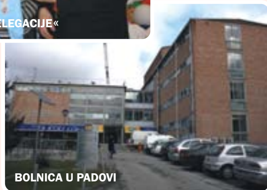
BOLNICA U PADOVI