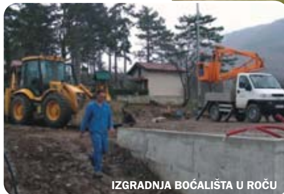
IZGRADNJA BOĆALIŠTA U ROČU

iznjedrila mnoštvo novih sportskih klubova. U tu svrhu,