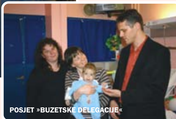
POSJET »BUZETSKE DELEGACIJE«

- David je dobro i oporavlja se. Oporavak će biti dug i težak ili, kako nam je jedan od