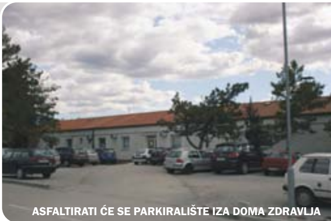
ASFALTIRATI ĆE SE PARKIRALIŠTE IZA DOMA ZDRAVLJA

poslovnim prostorom „Autotransa“, kada će se moći planirati nova prometna regulacija i u skladu s njom rekonstruirati cijeli kolnik u ulici.