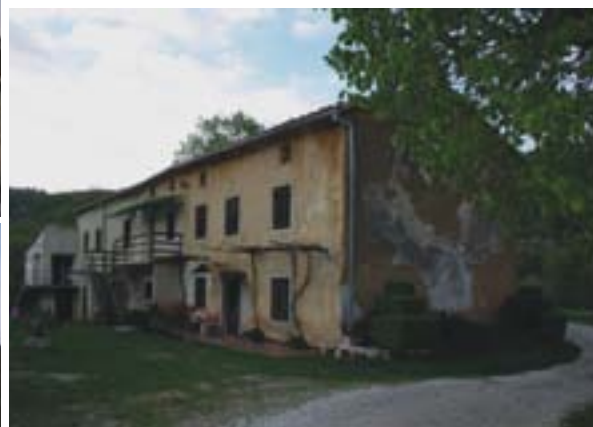
▲ ◀ DONJA HRBATIJA