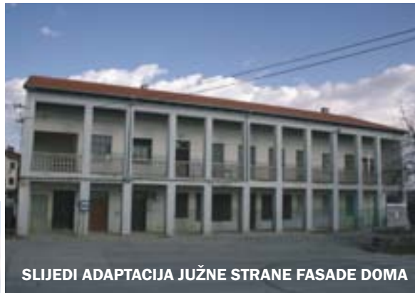
SLIJEDI ADAPTACIJA JUŽNE STRANE FASADE DOMA

području cijelog MO popraviti će se oštećeni dijelovi nerazvrstanih putova. Asfaltirat će se cesta R a c a r i – D u b r o v i c a, dužine 700-injak metara dok je prioritet spajanje sela Čabranija na vodovodnu mrežu. Po većim selima postavljene su