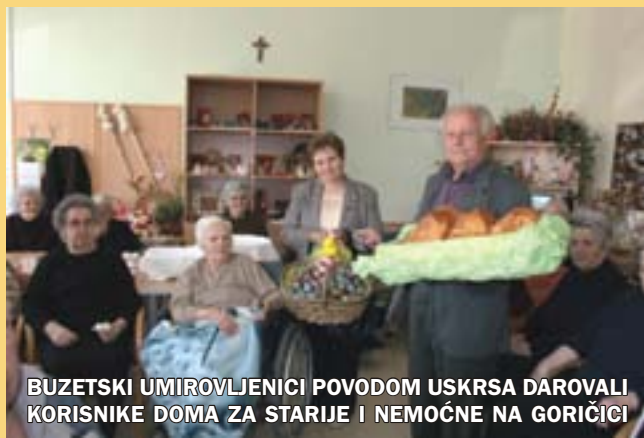
BUZETSKI UMIROVLJENICI POVODOM USKRSA DAROVALI KORISNIKE DOMA ZA STARIJE I NEMOĆNE NA GORIČICI