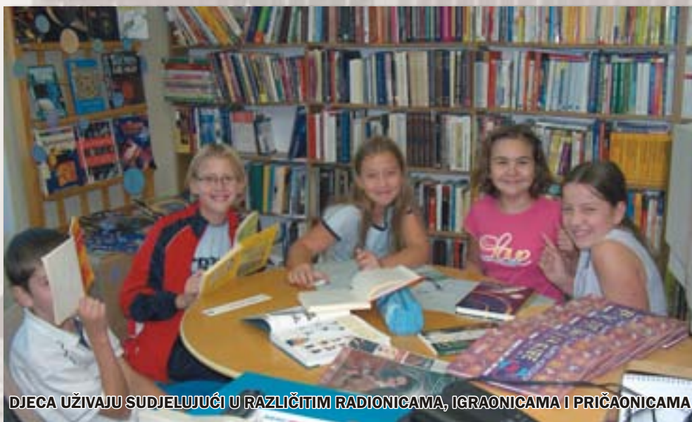
DJECA UŽIVAJU SUDJELUJUĆI U RAZLIČITIM RADIONICAMA, IGRAONICAMA I PRIČAONICAMA

izdanja, s posebnim naglaskom na izdanja koje obuhvaća zavičajna zbirka.