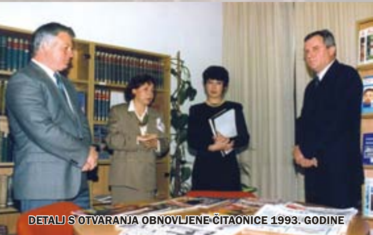
DETALJ S OTVARANJA OBNOVLJENE ČITAONICE 1993. GODINE

Svojim korisnicima osim posudbe knjiga nudi i besplatnu posudbu audiovizualne i multimedijalne građe te časopisa, stručne savjete knjižničara-informatora, pretraživanje lokalne baze podataka i baza podataka drugih knjižnica, usluge složenog pretraživanja, međuknjižničnu posudbu, pretraživanje interneta... Knjižnica omogućuje pet vrsta učlanjenja: članarinu za djecu, učenike, studente i umirovljenike; članarinu za odrasle zaposlene korisnike; obiteljsku članarinu; članarinu za posudbu slikovnica i privremenu članarinu – isključivo za rad u čitaonici i studijskom odjelu. Poseban dio knjižnice je Piquentina – buzetska zavičajna zbirka, koja sakuplja, obrađuje i čuva svu građu (knjige, periodiku, članke, notne zapise, audio i video materijale, fotografije, razglednice, letke, plakate...) o Buzeštini te izdanja buzetskih autora i nakladnika. Jedan od zadataka buzetske knjižnice je i prezentacija fonda te promocija novih izdanja. Stoga knjižnica redovito priprema izložbe različitih tema kojima predstavlja dijelove svoga fonda. Uz to knjižnica redovito organizira promocije novih