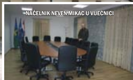
NAČELNIK NEVEN MIKAC U VIJEĆNICI