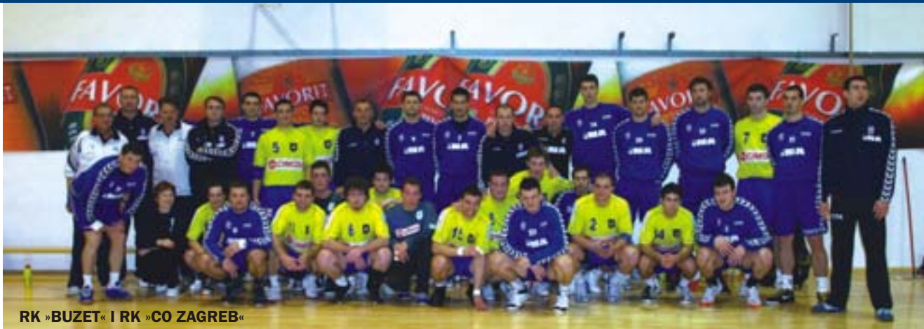
RK »BUZET« I RK »CO ZAGREB«