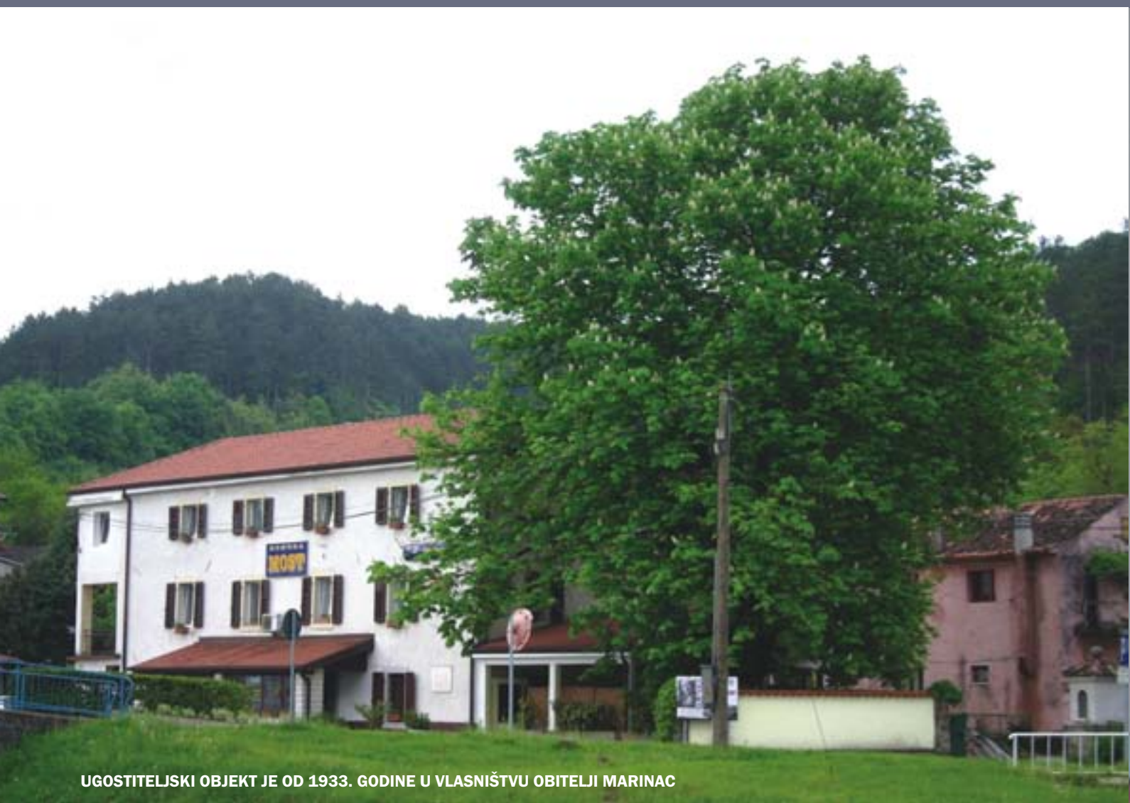
UGOSTITELJSKI OBJEKT JE OD 1933. GODINE U VLASNIŠTVU OBITELJI MARINAC

broju napraviti feštu. Znali su tada popiti i stotinjak litara vina na nedjelju, jer se osim vina i rakije i eventualno sode ništa drugo nije prodavalo. Sjećam se da su po odlasku obavezno pjevali „Rigament po cesti gre“. To je trajalo oko desetak godina. Naročito je bilo prometno za vrijeme trajanja stočnog sajma u Buzetu, koji je bio vrlo razvijen i popularan. Skupili bi se tih dana ljudi iz cijele Istre, a gostionica „Most“ bila je nezaobilazna stanica. Znali su se zaustaviti nekoliko sati nešto pojesti i popiti te krenuti dalje. Posebno su mi u