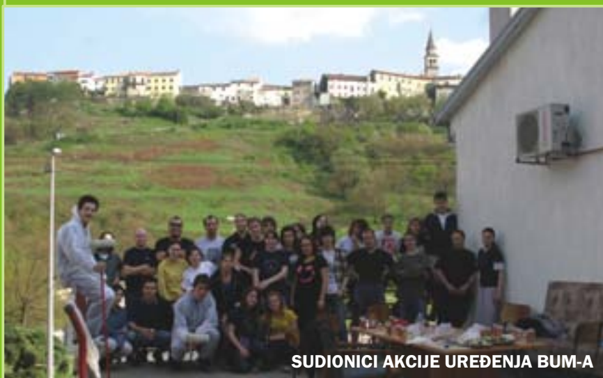
SUDIONICI AKCIJE UREĐENJA BUM-A

Riječica u Mlinima