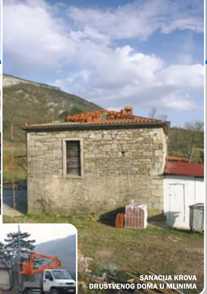
SANACIJA KROVA DRUŠTVENOG DOMA U MLINIMA

Iznimno razvijena kultura amaterskog sporta na Bužeštini, proteklih je godina