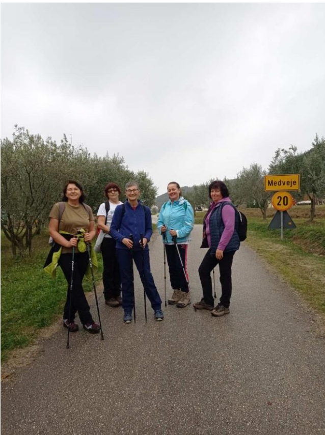
13.11.2021. Nordijsko hodanje