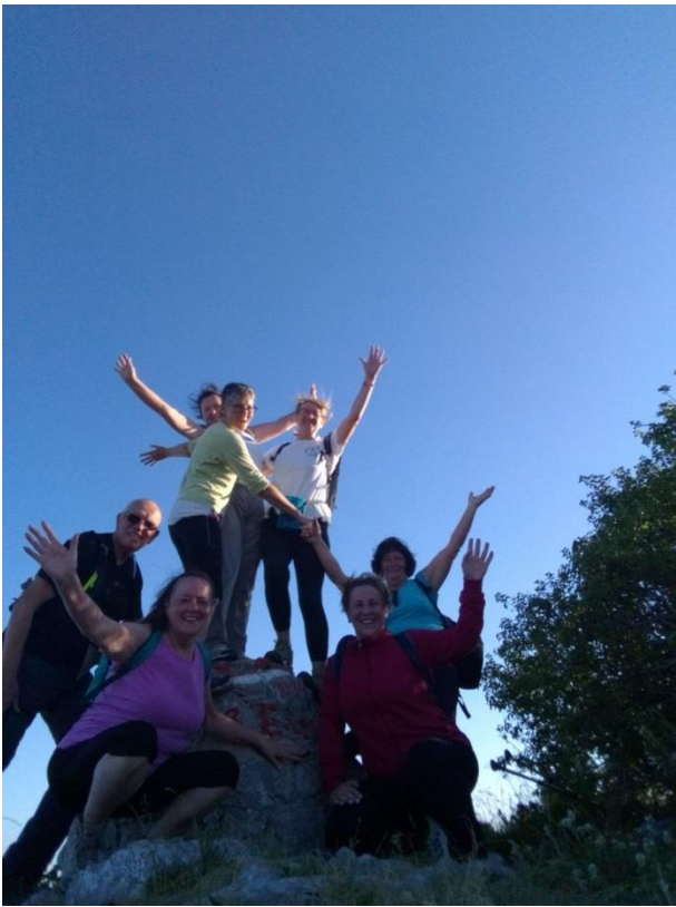
30.06.2021. Nordijsko hodaње