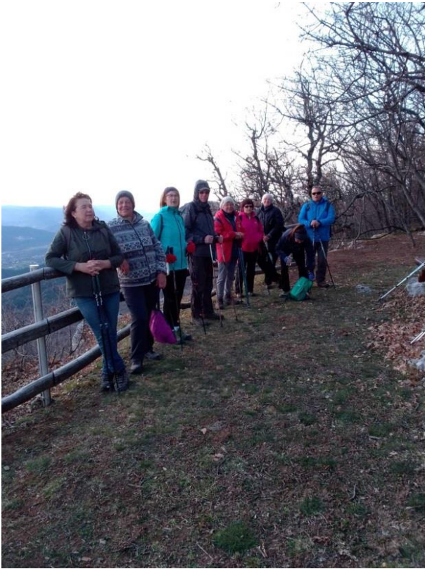
20. 03. 2021. Nordijsko hodanje