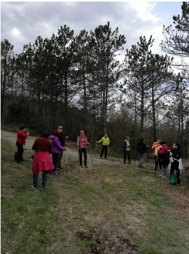
17.04.20212. Nordijsko hodanje