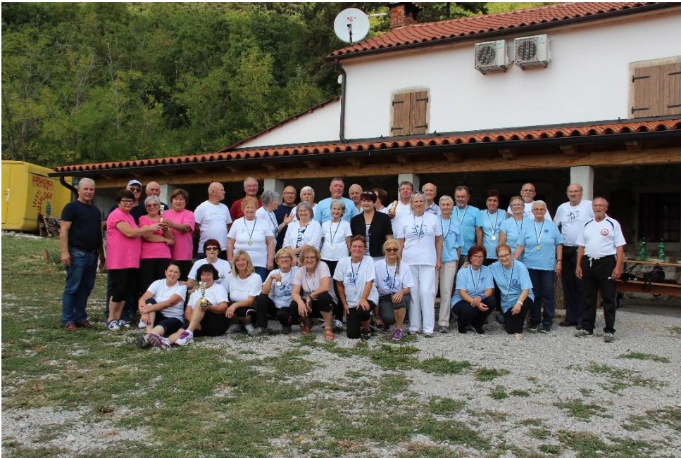
04.09.2021. Sportski susret umirovljenika "Subotina 2021". Održan u Roču. Sudjelovali su ekipe Roča, Buja, Pule i Buzeta. Ekipe su se nadmetale u boćanju i pikadu. Sudjelovalo je 45 umirovljenika.