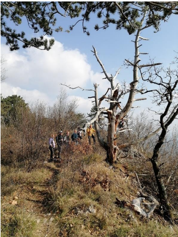
13.03.2021. Nordijsko hodanje