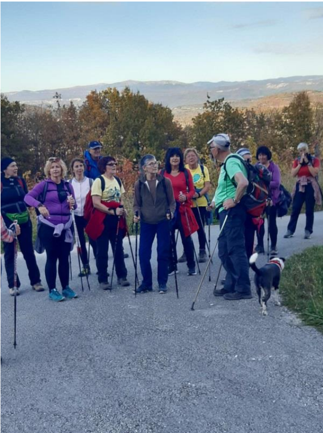
06.11.2021. Nordijsko hodanje