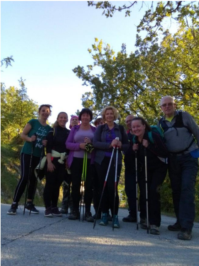
16.10.2021. Nordijsko hodanje