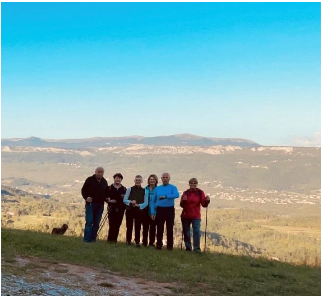
09.10.2021. Nordijsko hodanje