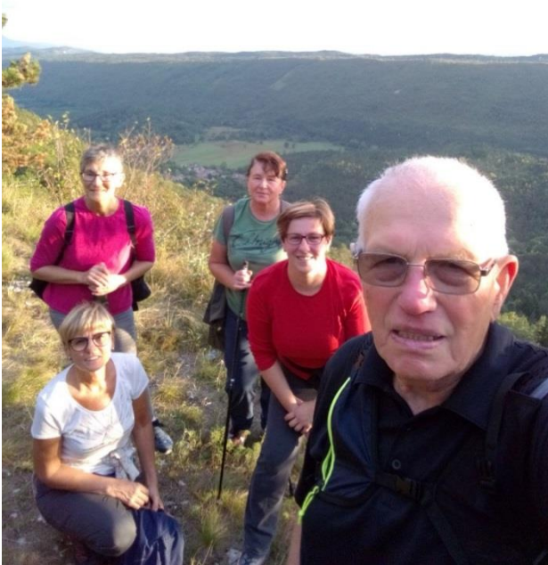
22.09.2021. Nordijsko hodanje