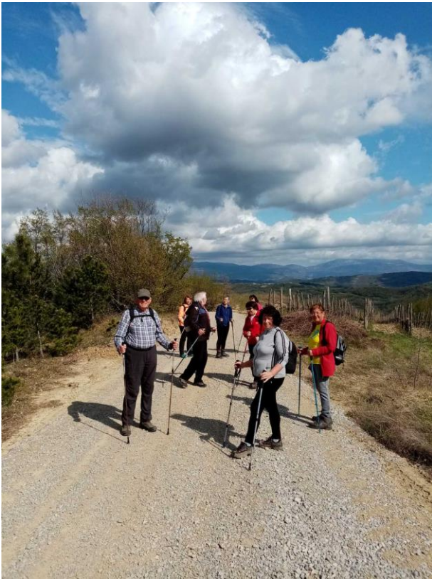
10.04.20212. Nordijsko hodanje