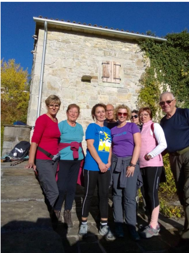
23.10.2021. Nordijsko hodanje