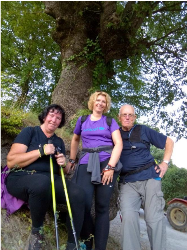
29.09.2021. Nordijsko hodanje