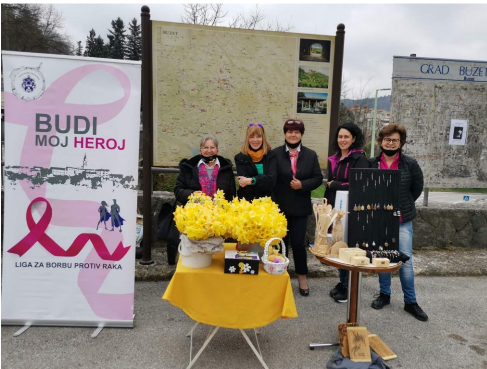
03.04.2021. Dan narcisa