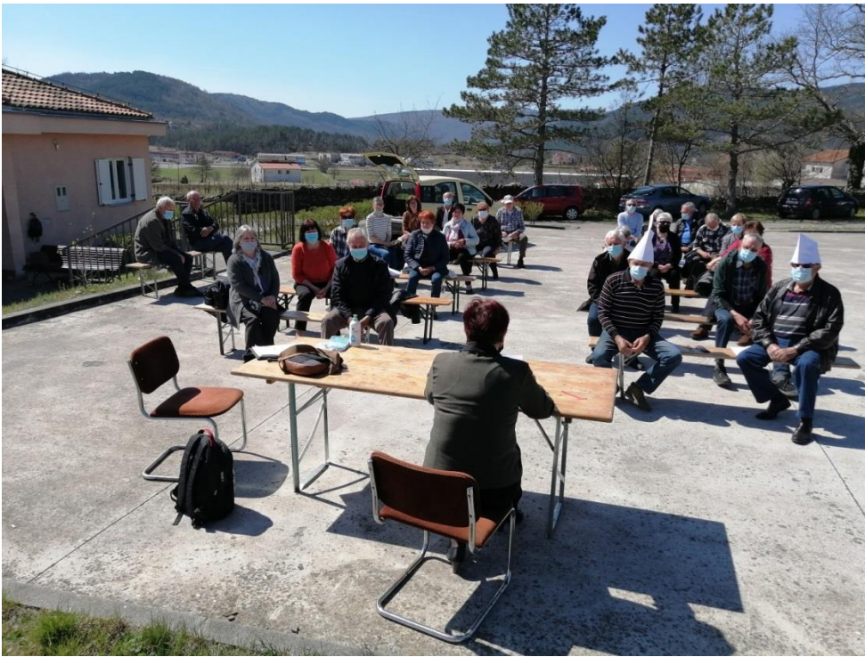
30.03.2021. Izborna skupština u Sv.Duhu