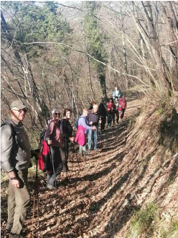
06.03.2021. Nordijsko hodanje