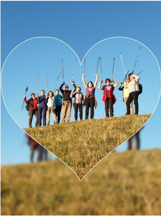
20.11.2021. Nordijsko h