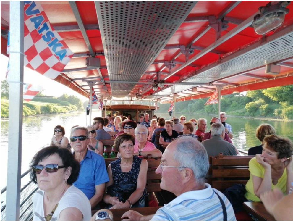
26.06.2021. Izlet Zagreb,