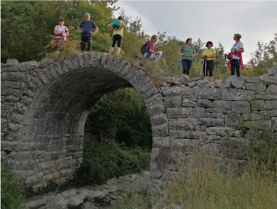
04.09.2021. Nordijsko hodanje