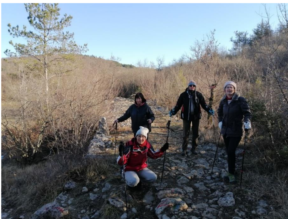
13.02.2021. Nordijsko hodanj