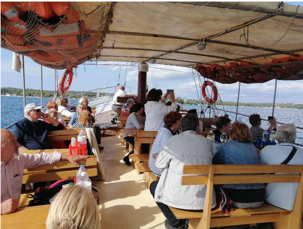
25.09.2021. Izlet brodom