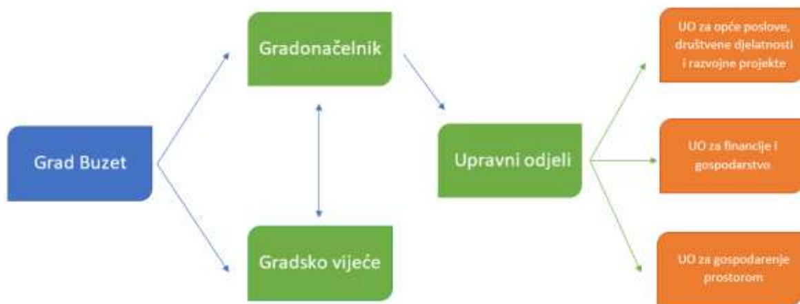
Slika 1 Organizacijska struktura Grada Buzeta

Za obavljanje poslova iz samoupravnog djelokruga Grada, kao i poslova državne uprave prenijetih na Grad, ustrojeni su Upravni odjel za opće poslove, društvenu djelatnosti i razvojne projekte, Upravni odjel za financije i gospodarstvo kao i Upravni odjel za gospodarenje prostorom.