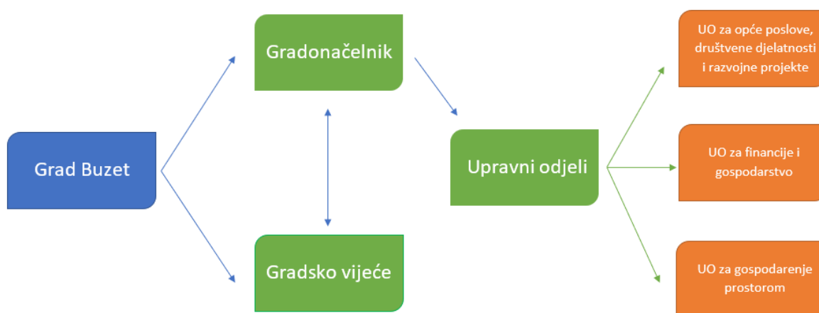
Slika 1 Organizacijska struktura Grada Buzeta

Za obavljanje poslova iz samoupravnog djelokruga Grada, kao i poslova državne uprave prenijetih na Grad, ustrojeni su Upravni odjel za opće poslove, društvenu djelatnosti i razvojne projekte, Upravni odjel za financije i gospodarstvo kao i Upravni odjel za gospodarenje prostorom.